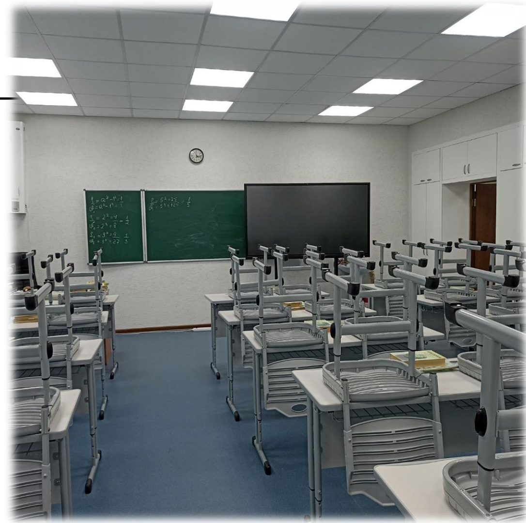
Отремонтированы 2 кабинета биологии, лаборантские, приобретено оборудование